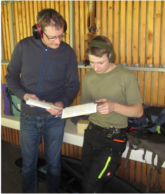
Foto Eidg. Schützenfest Luzern. Geschossen in Nunningen